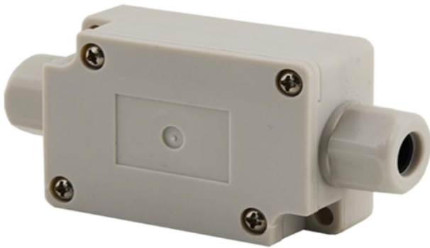
Abbildung 1: Draufsicht geschlossen